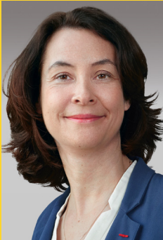
Estelle Brachlianoff, Directora General de Veolia

E n todos los lugares en los que Veolia se halla presente, tiene el firme compromiso de promover, en coherencia con su propósito adoptado el 18 de abril de 2019, sus propios valores, la legislación de cada país y las normas de conducta dictadas por los organismos internacionales, así como de fomentar el cumplimiento de las mismas..